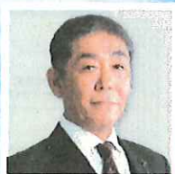
鹿島アントラーズ 取締役 事業本部長