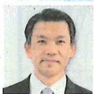
スポーツ庁 民間スポーツ担当 参事官