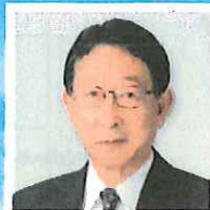
山梨中央銀行 会長 甲府商工会議所 副会頭