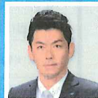
公益社団法人日本青年会議所 関東地区 山梨ブロック協議会 会長