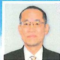
山梨総合研究所 専務理事