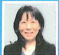
山梨学院大学 現代ビジネス学部 教授