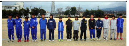
2008年 山梨県優秀選手表彰